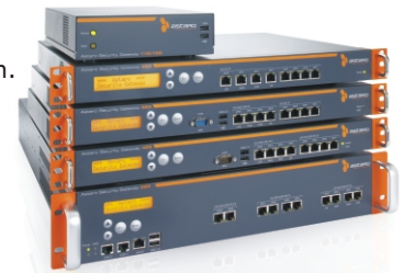
Astaro Hardware Appliances

Automatische Firmware- und Pattern-Aktualisierungen stehen über den Astaro Up2date Service im Rahmen aller Wartungsverträge zur Verfügung.