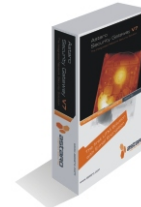
Astaro Software Appliance